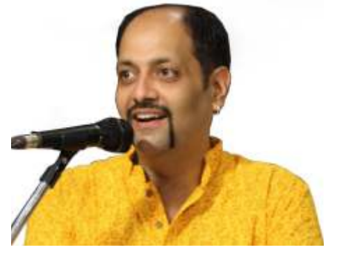
Young Turks of Parle पान ४