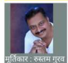
मूर्तिकार : रुस्तम गुरव

गेल्या २८ वर्षांपासून या व्यवसायात कार्यरत आहे.