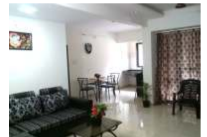
A Project by - SVR Developers, Mumbai

Near Sawantwadi Railway Station, Sawantwadi - Vengurla Road Front.