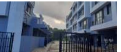
A Project by - Icon Realty, Mumbai

Lift | Independent Parking | 24 Hours Water Supply Spacious Rooms